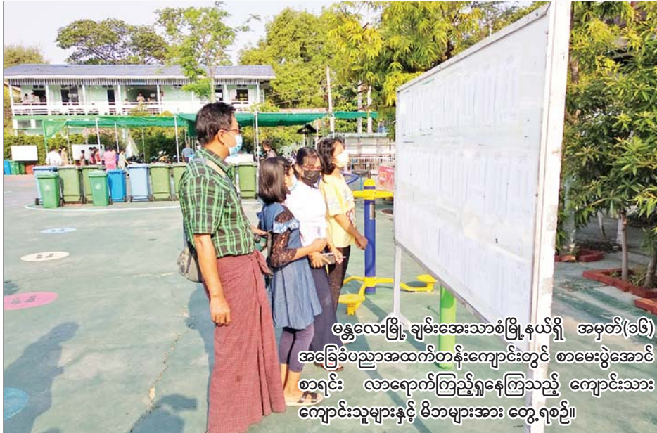
မန္တလေးမြို့ ချမ်းအေးသာစံမြို့နယ်ရှိ အမှတ်(၁၆) အခြေခံပညာအထက်တန်းကျောင်းတွင် စာမေးပွဲအောင်စာရင်း လာရောက်ကြည့်ရှုနေကြသည့် ကျောင်းသား ကျောင်းသူများနှင့် မိဘများအား တွေ့ရစဉ်။