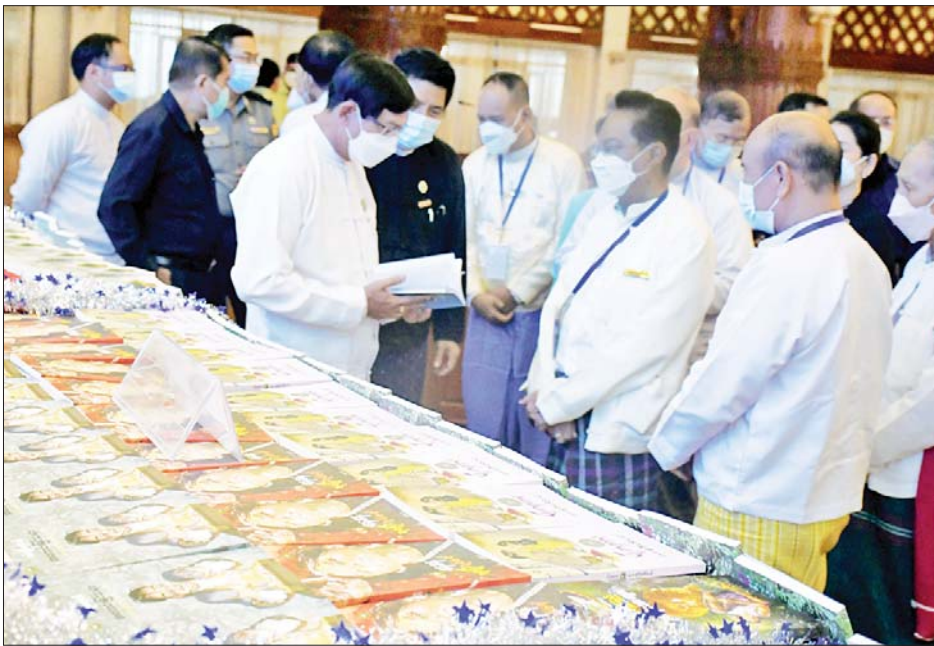
၏လူမှုဘဝများတိုးတက်စေရေးအတွက် လိုအပ်သည့် သတင်းအချက်အလက်များရယူအသုံးပြုနိုင်သောနေရာ၊ ကမ္ဘာလုံးဆိုင်ရာ ဖွံ့ဖြိုးတိုးတက်မှုများအတွက် အကောင်းဆုံးသော လုပ်ဖော်ကိုင်ဖက်များရှာဖွေသောနေရာအဖြစ် ပြောင်းလဲလာစေဖို့ စာကြည့်တိုက်များ ကြီးကြပ်ရေး

ရန်ကုန် ဧပြီ ၂၄ ရန်ကုန်တိုင်းဒေသကြီးအစိုးရအဖွဲ့က တိုင်းဒေသကြီးအတွင်းရှိ ရပ်ကွက်/ကျေးရွာစာကြည့်တိုက်များအတွက် စာအုပ်စာစောင်များ လှူဒါန်းပွဲအခမ်းအနားကို ဧပြီ ၂၂ ရက်က တိုင်းဒေသကြီးအစိုးရအဖွဲ့ရုံး မင်္ဂလာခန်းမတွင်ကျင်းပသည်။ သတင်းအချက်အလက်ပြန်ပေး ရန်ကုန်တိုင်းဒေသကြီးဝန်ကြီးချုပ် ဦးစိုးသိန်းက တိုင်းဒေသကြီးအတွင်း၌ ဖွင့်လှစ်ခဲ့သော စာကြည့်တိုက် ၄၈၁ တိုက်ရှိရာ စာကြည့်တိုက် ၁၂၀ အတွက် ရန်ကုန်တိုင်းဒေသကြီးအစိုးရအဖွဲ့က ငွေကျပ် ၅၅ သန်း တန်ဖိုးရှိစာအုပ်စာစောင်များကို ထောက်ပံ့လှူဒါန်းပေးခြင်းဖြစ်ကြောင်းနှင့် ယနေ့အချိန်တွင် ပြည်သူ့စာကြည့်တိုက်များသည် စာပေးစာဖတ်ရုံသာ မဟုတ်တော့ဘဲ ပြည်သူများ