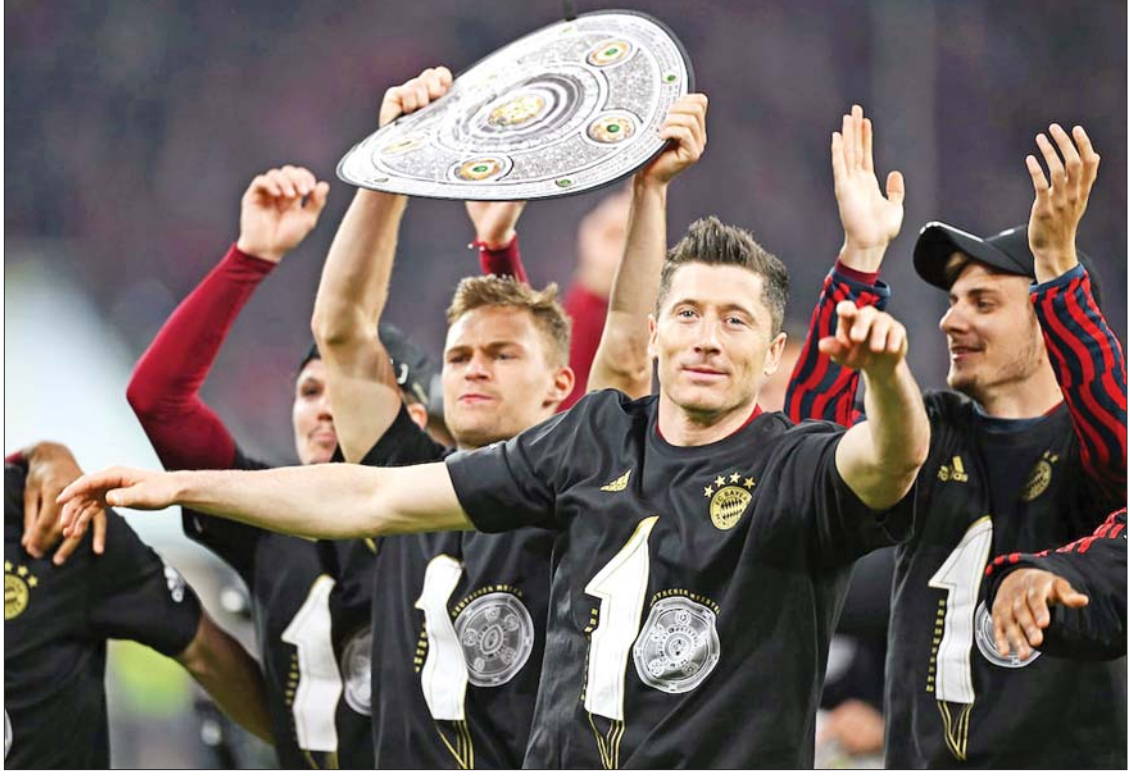
စာမျက်နှာ » ၂၂

ဘိုင်ယန်မြူးနစ်အသင်း ဘွန်ဒက်လီဂါဖလား (၁၀)ကြိမ်ဆက်တိုက် ဆွတ်ခူး