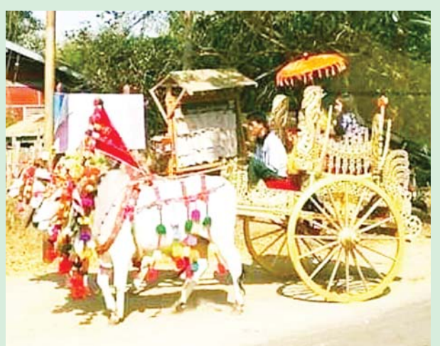
(ခေါ်) နွားလှည်းယဉ်များတိမ်ငုပ် ပျောက်ကွယ်မသွားစေရန် လက်ဆင့်ကမ်း ထိန်းသိမ်းစောင့်ရှောက်သွားရန် လိုအပ်သည်။ ဇေယျာထက်(မင်းဘူး)

နွားလှည်းယဉ်တွင် ဆင်စွယ်ညွတ်၊ ဇင်ယော်တောင်၊ မွန်းတည့် ကောက်ဟူ၍ သုံးမျိုးသုံးစားရှိသည်။ ထိုလှည်းယဉ်သည် အလှူ မင်္ဂလာ ပွဲလမ်းသဘင်များတွင် နွားအလှူယဉ် ပြိုင်ပွဲများအဖြစ်လည်း ကောင်း၊ ဘုန်းတော်ကြီးများ ပင့်ဆောင်ရာတွင် လည်းကောင်း အသုံးပြုကြသည်။ နွားလှည်းယဉ်ကို ပုဂံ၊ ပင်းယ၊ အင်းဝ၊ ကုန်းဘောင် စသဖြင့် ခေတ်အသီးသီးတွင် ပုံစံအမျိုးမျိုးဖြင့် အသုံးပြုကြသော် လည်း နှောင်းခေတ်ကာလတွင် တောဓလေ့သဘာဝနှင့် လိုက်ရာ ညီထွေမှုရှိစေရန် ပြုပြင်တည်ဆောက် အသုံးပြုလာကြသည်။