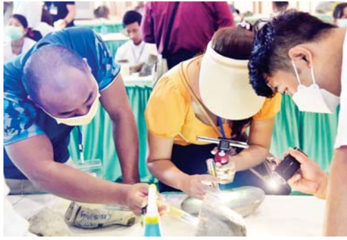
စာမျက်နှာ » ၄

(၅၇)ကြိမ်မြောက် မြန်မာ့ကျောက်မျက်ရတနာပြပွဲ တတိယနေ့ ဆက်လက်ကျင်းပ