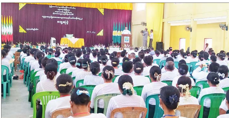
နာသုံးနာကို အခြေခံ၍ အများအကျိုးပြုကာ လောက ကို အလှဆင်နေသူများဖြစ်ကြောင်း၊ တပည့်တွေ အပေါ် စာကိုလည်း သင်၍ လူကိုလည်းပြင်ရန် လိုအပ် ကြောင်း၊ ယခုလာမည့် စာသင်နှစ်တွင် ကျောင်းနေ အရွယ်ကလေးအားလုံး ရာနှုန်းပြည့် ပညာသင်ကြား နိုင်ရေး ဆရာ၊ မိဘ၊ အုပ်ချုပ်ရေးအဖွဲ့များ အတူ

ဘိုကလေး ဧပြီ ၂၄ ဧရာဝတီတိုင်းဒေသကြီး ဘိုကလေးမြို့နယ်ရှိ ဘိုကလေး ပညာရေးဒီဂရီကောလိပ်တွင် ဧပြီ ၂၀ ရက်မှ မေ ၂၅ ရက်အထိ ပညာရေးဘွဲ့ စာပေးစာယူ ပထမနှစ်သင်တန်း(၁/၂၂)ကို ဖွင့်လှစ်ပို့ချသင်ကြား လျက်ရှိရာ ယနေ့မှန်းလွဲ ၂ နာရီခွဲတွင် အဆိုပါ သင်တန်းသား သင်တန်းသူများအား ဘိုကလေး ပညာရေးဒီဂရီကောလိပ်ခန်းမ၌ ဧရာဝတီတိုင်း ဒေသကြီး ဝန်ကြီးချုပ် ဦးတင်မောင်ဝင်းက တွေ့ဆုံ ခဲ့သည်။